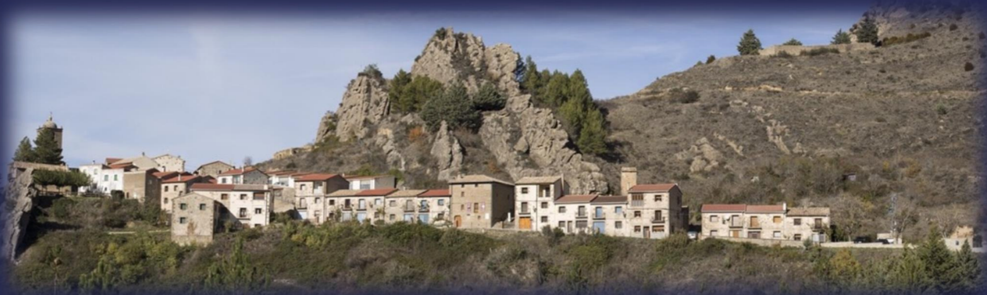
Petilla de Aragón