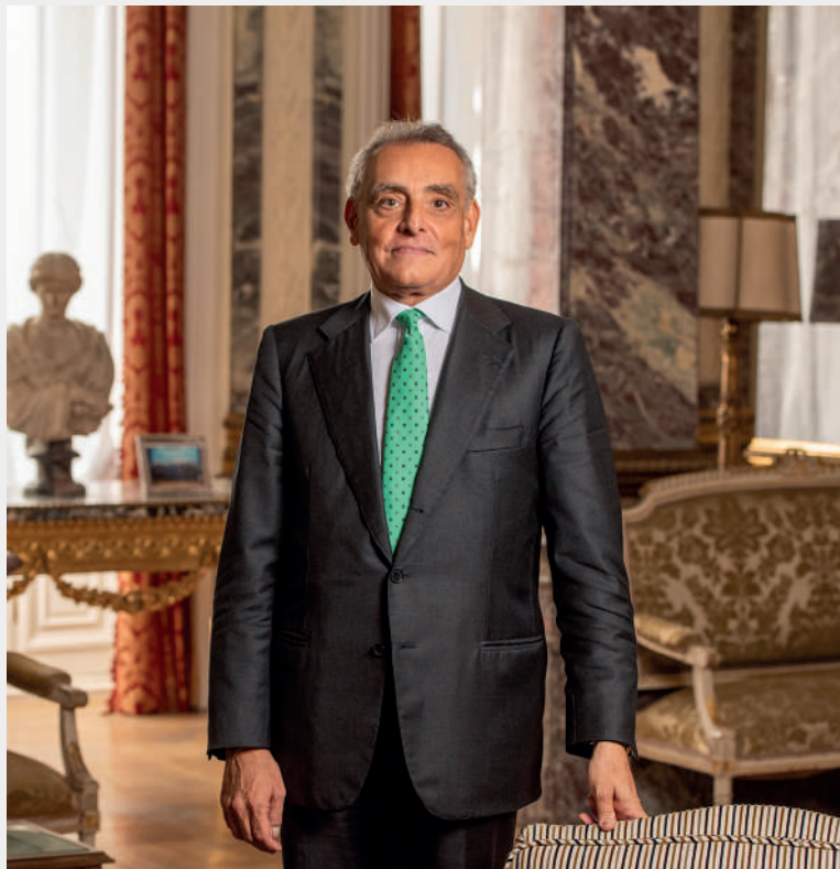
Giuseppe Buccino Grimaldi Embajador de Italia en España y Andorra